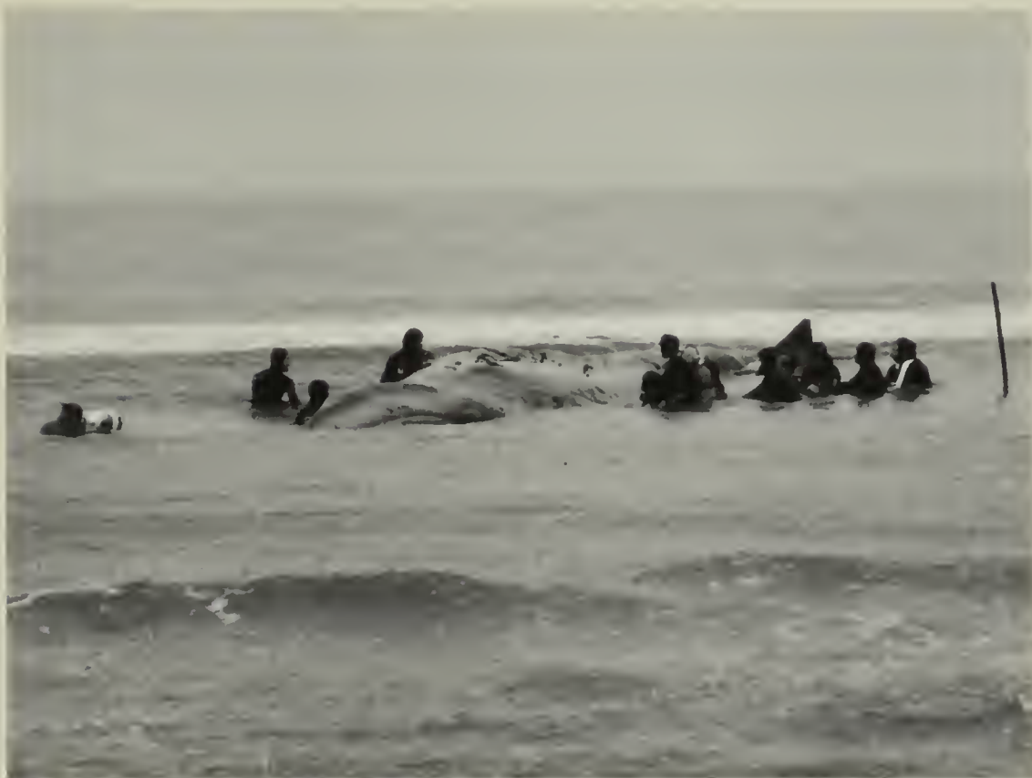
Fig. 2 – Una delle fasi di soccorso alla balenottera comune ( Balaenoptera physalus ) spiaggiata ancora viva a Calambrone (Livorno) il 15 ottobre 1990. Dopo il decesso l'esemplare è stato recuperato dal Museo di Storia Naturale di Livorno.